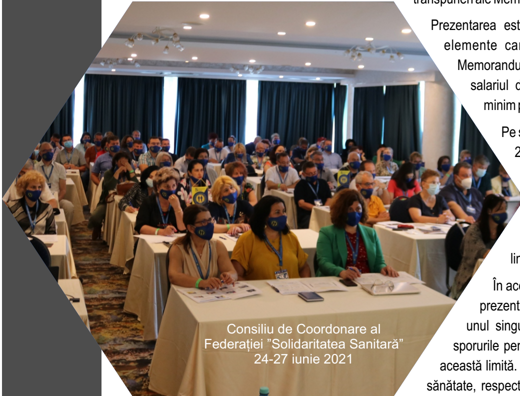
Consiliu de Coordonare al Federației "Solidaritatea Sanitară" 24-27 iunie 2021

Studiul elaborat la începutul lunii iunie 2021 de Centrul de Cercetare și Dezvoltare Socială "Solidaritatea" pe tema acestui Memorandum a urmărit să expună efectele nefaste asupra salariaților din Sănătate ale unei eventuale transpuneri ale Memorandumului în act normativ.